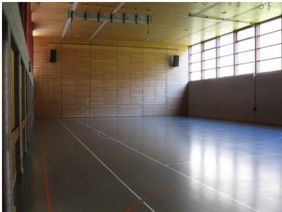
MZH - Turnhalle